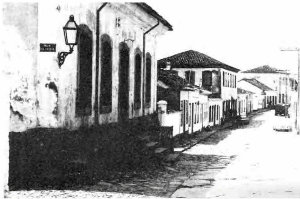
La Rua Direita, a la izquierda se puede ver la cárcel

Nadie permanece en ella por más de un par de días y, generalmente, debido a rencillas de borrachos. Los casos más serios, si los hay alguna vez, son trasladados a la ciudad grande donde las celdas, por cierto, miran hacia el interior de la prisión. La espectacular Sierra de São José, como un muro ciclópeo que parece proteger esta pequeña joya, donde el ensueño y la nostalgia pueden llegar a ser el estado de ánimo normal de un forastero.