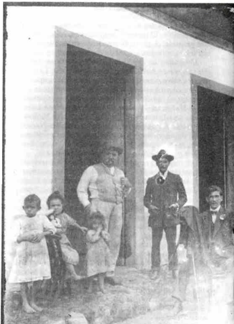
El fotógrafo de la ciudad con amigos al principio de siglo.

distinción de ese futuro personal deseado y el futuro probable. Nos sorprendió ver una gran disparidad de opiniones, entre un 77 por ciento de los niños de la ciudad y un 46 por ciento de los del campo. En todos los casos ellos querían ser algo que sabían era imposible de lograr. No demostraban una actitud de rebelión sino más bien parecían conformarse con lo que la sociedad les había reservado. Sólo un 23 por ciento de los niños urbanos expresó su fe en su capacidad para superar su actual situación indeseable. Los niños del campo eran aún más sumisos en su aceptación del destino.