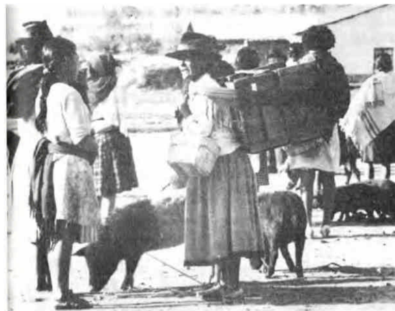
Mujeres campesinas en el mercado, para ofrecer sus productos.

Cosecha en verde : El intermediario le presta dinero al campesino calculando el rendimiento de la cosecha sobre el trigo o maíz recién sembrado y luego éste debe saldar la deuda en el momento de la venta. Casi nunca puede cumplir su compromiso.