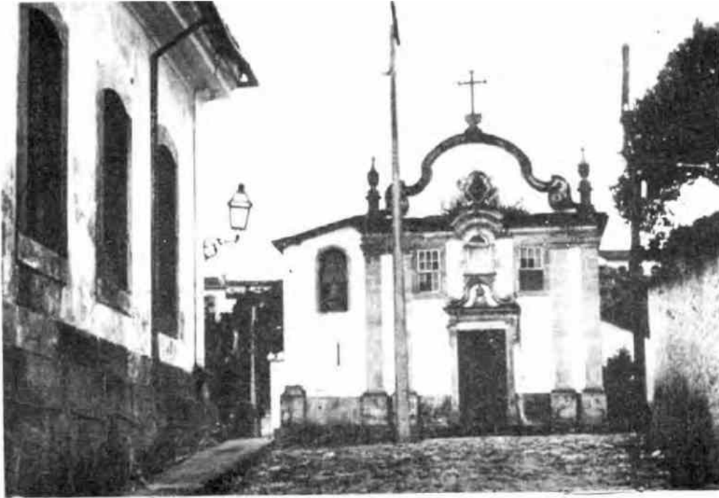
Subiendo por la calle escarpada que lleva hacia la iglesia de Nuestra Señora del Rosario de los Negros, se puede ver la vetusta cárcel con sus viejas rejas de fierro que dan a la calle para que los reclusos puedan conversar con sus amigos.