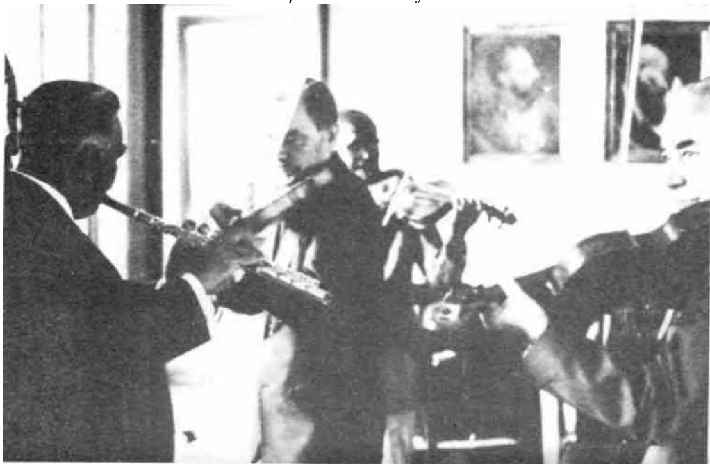
Miembros de la orquesta Ramalho ofreciendo un concierto en Tiradentes.

porque un siniestro plan de explotación se ocultaba en las mentes de los dirigentes del Proyecto Tiradentes. No sólo estaban aterrados sino que además resentidos con nosotros.