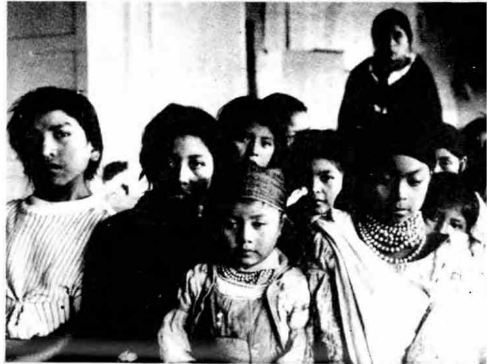
Niños de la sierra en la escuela

Wiracocha : Nombre de un dios de la mitología inca. Era un dios que vendría por el mar.