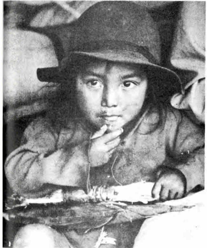
Un trocito de caña de azúcar; es todo su almuerzo.

Marimba : Instrumento musical parecido al xilófono pero construido con lenguas de madera y cañas, que se toca acompañado de tambores