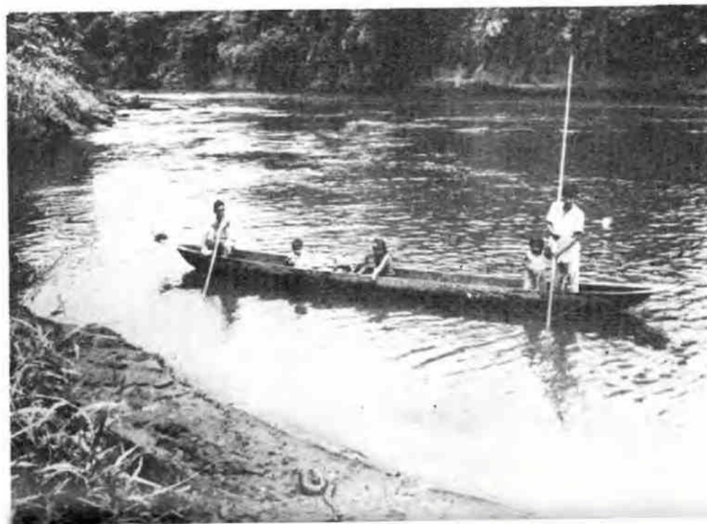
Familia cayapa en su piragua. En la orilla del río se puede ver una serpiente.