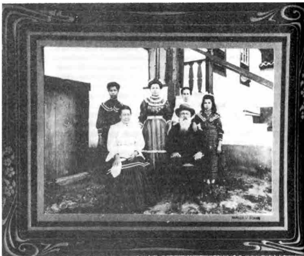
Un patriarca con sus familiares en el año 1880.

la calidad de la muestra fueron muy alentadores y los artesanos del distrito sintieron que por primera vez en sus vidas su dignidad y su trabajo habían recibido su espaldarazo público. Se vendió prácticamente todo y el dinero se entregó a los artesanos. Algunos apenas podían creerlo pues nunca habían tenido tanto dinero en sus manos. Se había iniciado una nueva etapa en la vida de esa gente. Rescatados de su anonimato tradicional, estaban adquiriendo confianza en sí mismos y en su trabajo. Se había dado el primer paso pero aún quedaba mucho trecho por recorrer.