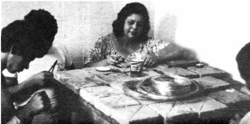
Aprendices de la gúilda de artesanos trabajando en la revitalización del tradicional trenzado de plata.

Después de imprimir una lista de todos los cursos disponibles les pedimos a las «Cofradías» que la hicieran circular entre las familias de sus miembros para ver si había suficiente interés. Nos sorprendió el número de matrículas, de modo que decidimos seguir adelante.