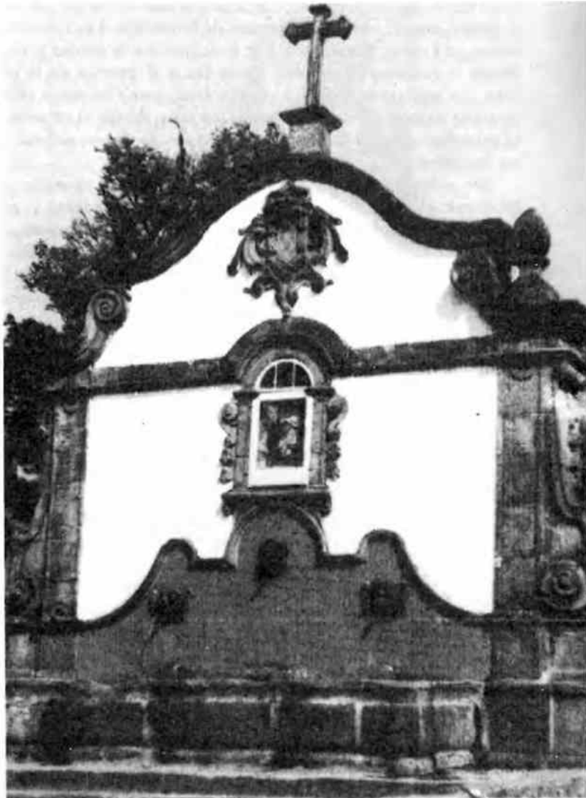
El Chafariz, fuente de la ciudad. En uso desde 1749.

dicho, los horarios del reloj. Sólo corregí mi actitud, cuando descubrí que el tiempo de la gente estaba regulado por acontecimientos. A corto plazo, por los acontecimientos diarios: las cosas se hacen antes o después de la misa, antes o después de las clases, después de la reunión del concejo municipal, y así sucesivamente. El largo plazo es planificado y regulado de acuerdo a las fiestas religiosas o patrióticas, que son por cierto numerosas. La responsabilidad de una persona en la organización de una fiesta es un deber que está por encima de cualquier otro compromiso.