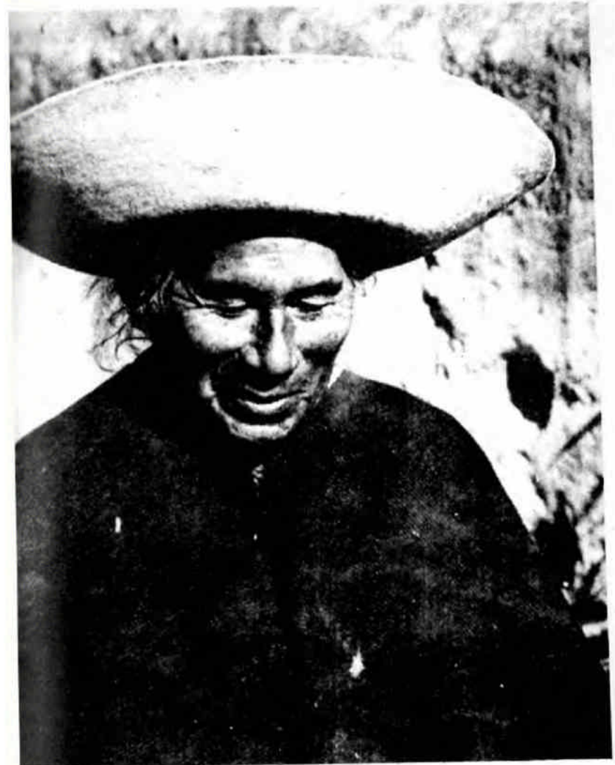
Campefino de la sierra.

Huasipungueros : Indio que trabaja una parcela de tierra otorgada por el dueño de la hacienda y donde levanta su choza y cultiva