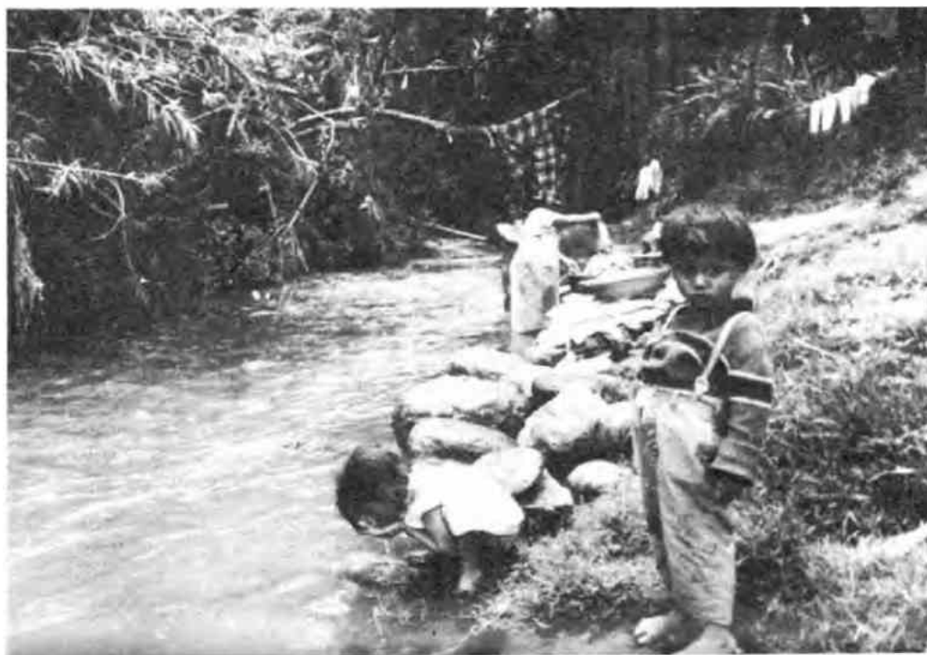
Niños que beben agua en un río contaminado

Chuchaqui : Estado de malestar que sigue a la borrachera