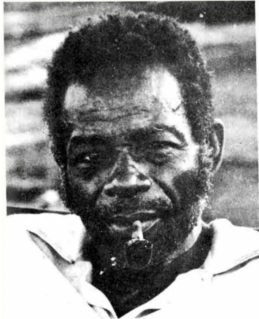
Campesino de la costa en la Provincia de Esmeraldas.