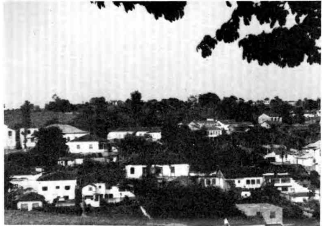
Vista parcial de Tiradentes