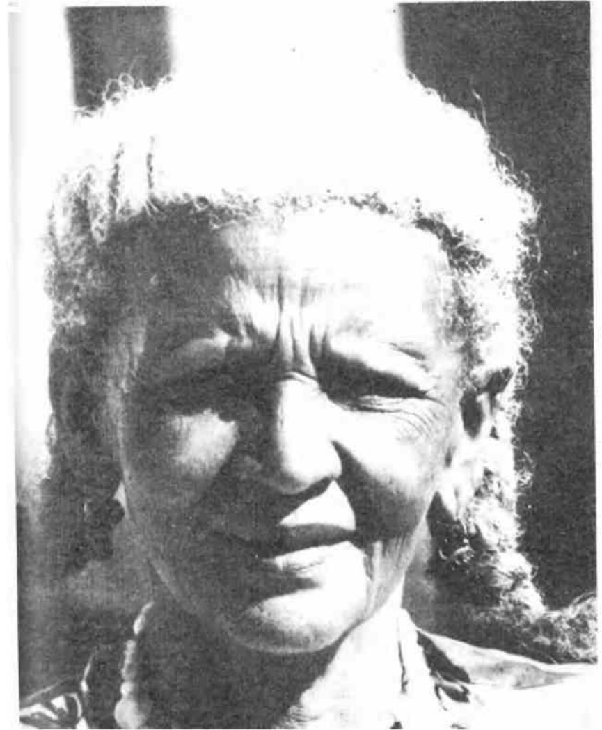
Campesina de la costa en la Provincia de Esmeraldas.

Atahualpa : Último inca del Imperio Incaico. Capturado y condenado a morir, en el garrote vil, por Francisco Pizarro después, de que cumpliera con el pago de su rescate en oro y plata.