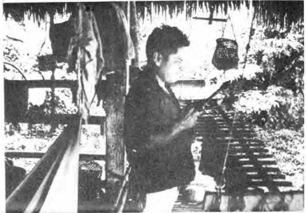
Un cayapa tocando la marimba

El caso de una señora que por delicadeza no la identifico, manda a una niña a que le pase agua, como no había en casa, la pequeña toma camino al río y se provee de agua en una calabaza, regresa la niña a oscuras y la señora solicita beber en la calabaza. Al pegar los primeros tragos siente que sus labios son acariciados por algo ya sólido, se sorprende, escancia el líquido para