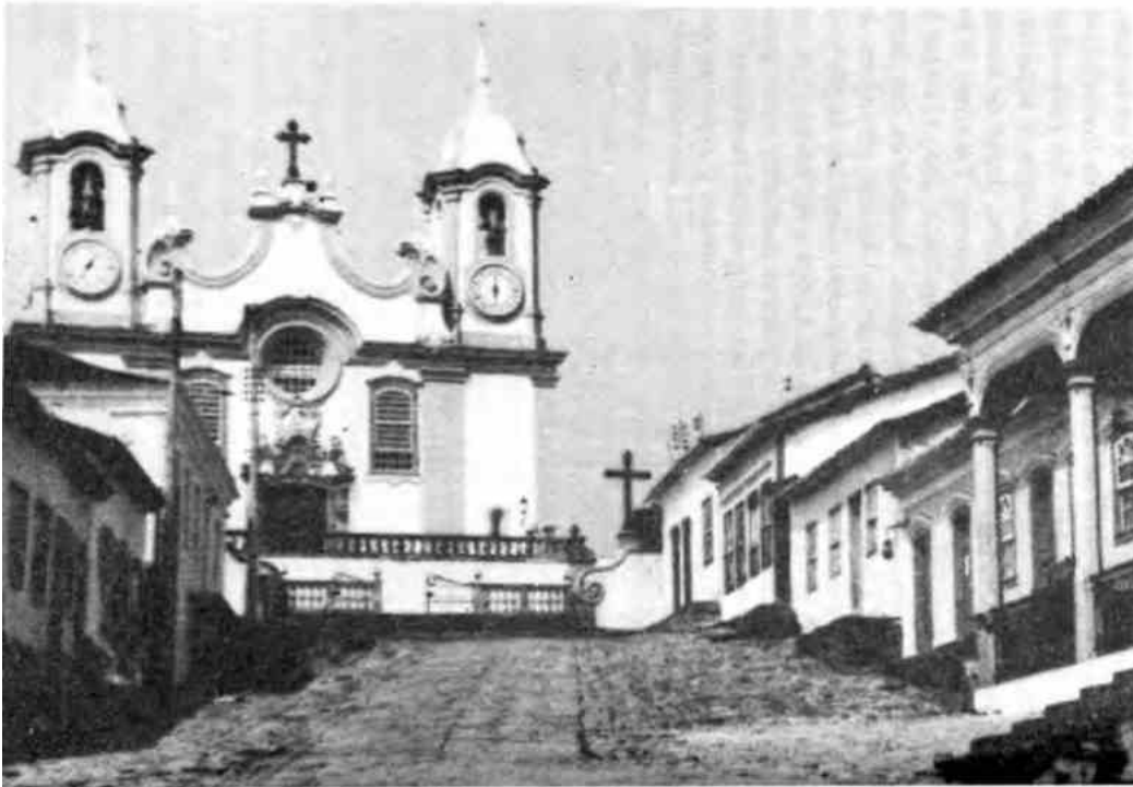
El viejo Foro y la iglesia de Santo Antonio.

tiende a convertirse en demasiado posesivo. Ése es el momento en que uno debe apartarse o establecer un tipo de relación diferente, como una simple amistad sin compromisos, de ser posible. De otro modo, llega el momento en que el informante informa cada vez menos y manipula cada vez más. Si surgen discrepancias entre la información recibida y la realidad percibida en forma independiente, la ruptura bien puede estar a la vuelta de la esquina.