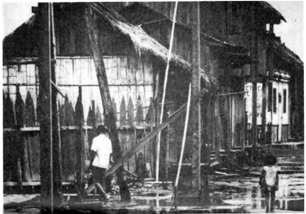
«Casas iguales, como animales de largas patas clavados sobre el borde del río.»

El cuadro es realmente espantoso y horrorizante, pues la gran mayoría de los jefes de familia, perciben un salario que va de los diez a los quince sucres diarios, los hombres en calidad de peones de una hacienda ganan miserables salarios que sirven para cubrir gastos