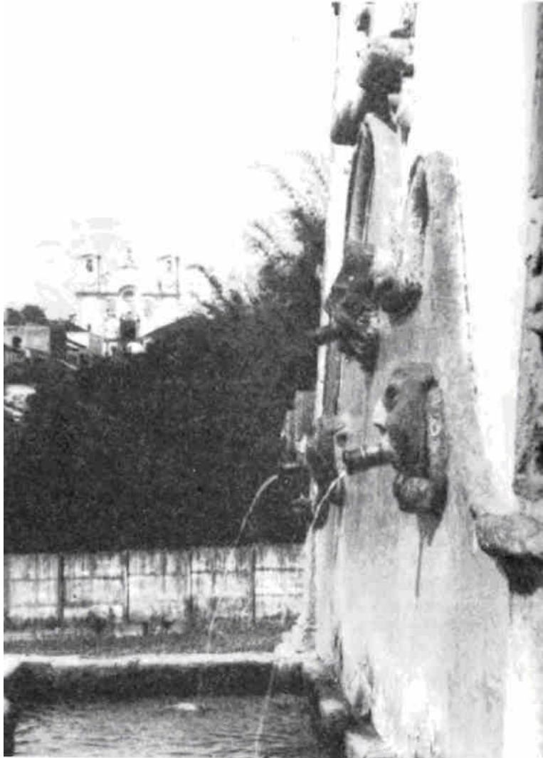
El Chafariz con la iglesia de Santo Antonio al fondo.

proyecto que existía solamente en mi mente y en la mente del Director General de SENAC (quién me había invitado); sin oficina, sin ayudas o infraestructura alguna. En realidad podría haber hecho cualquier cosa... o nada, porque ni siquiera tenía términos de referencia. Dada la situación, decidí dedicarme como primer paso, a comprender mi entorno. Tal como lo he descrito, empecé por captar el entorno físico, pero el factor humano continuaba siendo una incógnita. Además en ese tiempo no tenía un conocimiento adecuado del idioma portugués, lo que dificultó muchísimo mi comunicación inicial con la gente. Como abundamiento, mi estatura de 1.96 m., mi barba y mi aspecto de vikingo, no hay duda de que me convertía en un personaje sumamente extraño en esta pequeña ciudad tradicional. Sospecho que fui causa de muchos comentarios y especulaciones en los bares y demás sitios de reunión. Como anteriormente había trabajado en áreas rurales y en comunidades indígenas, ya estaba acostumbrado a esta situación y no me inquietaba mayormente. Estaba tratando de acostumbrarme a la ciudad y la ciudad, a su vez, terminaría por acostumbrarse a mí.